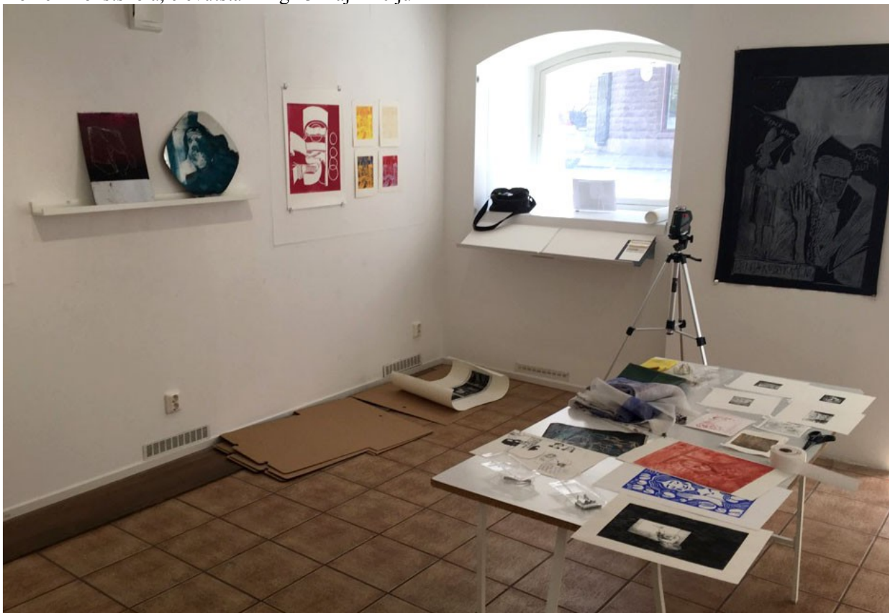
(elevutställningen under hängning)

Dômen Konstskola, elevutställning 23 maj – 10 juni