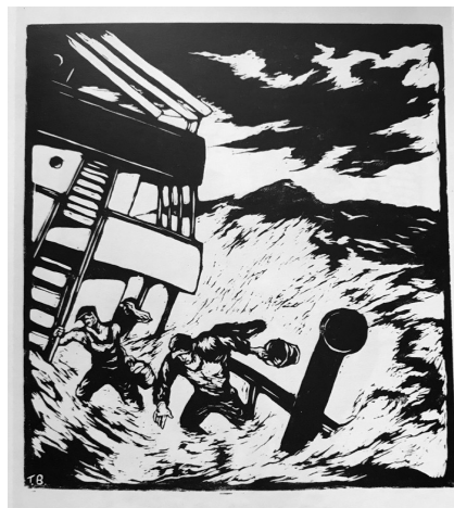
Eldare går över däck i storm